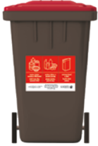
Bin du gyda sticer coch