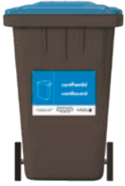
Bin du gyda sticer glas