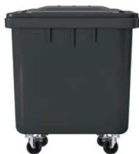
Bin du gyda chaead du